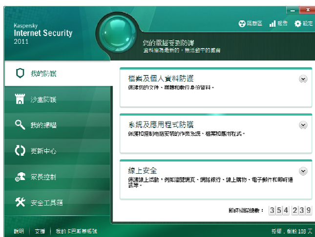
圖一。卡巴斯基 2011 使用介面。