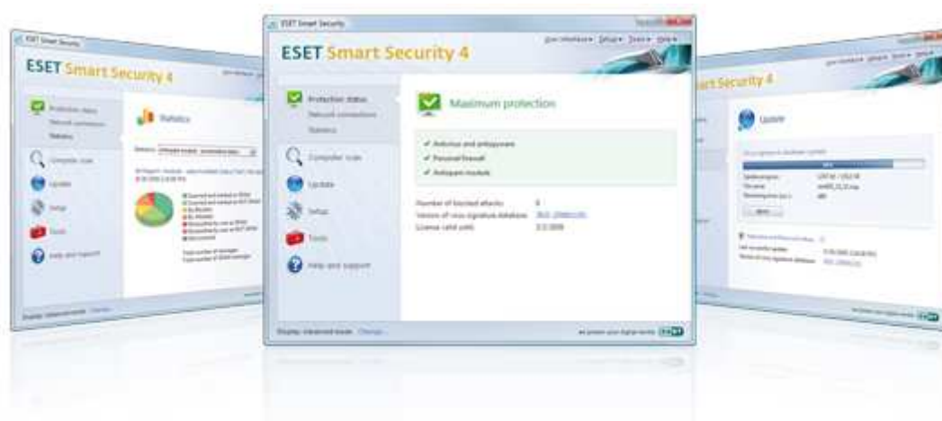
圖二。ESET Smart Security4 使用者介面。

ESET 台灣官方網站- ESET Smart Security4。2010 年 10 月 19 日，取自