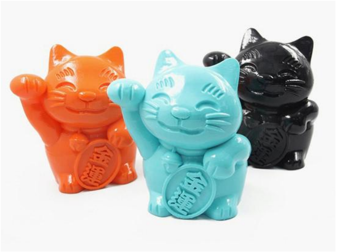
螢光藍 Fluorescent Blue