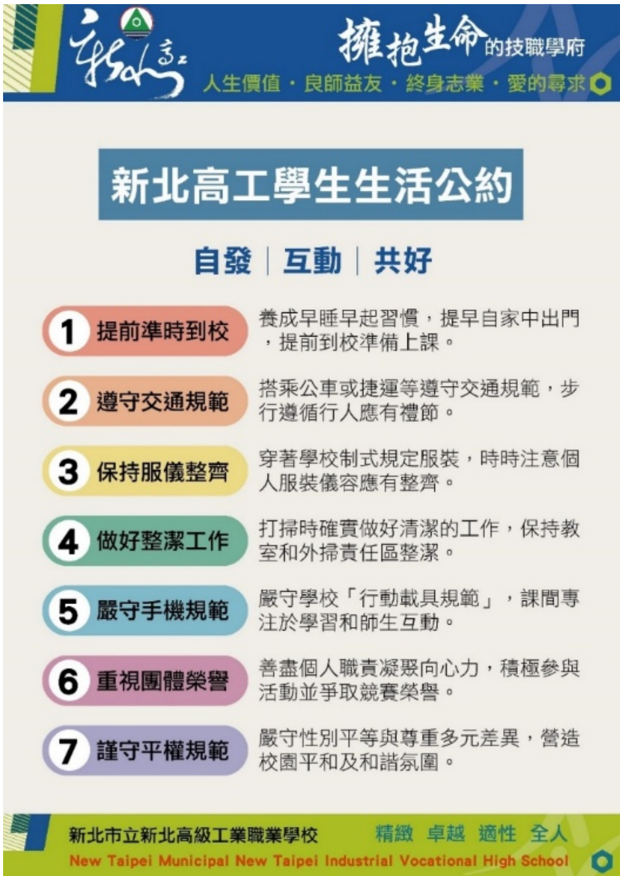
圖 新北高工學生生活公約