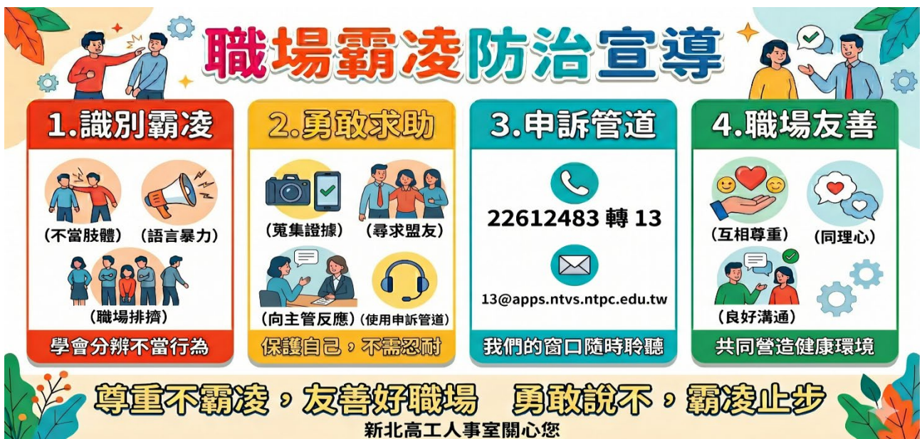
圖 職場霸凌防治宣導