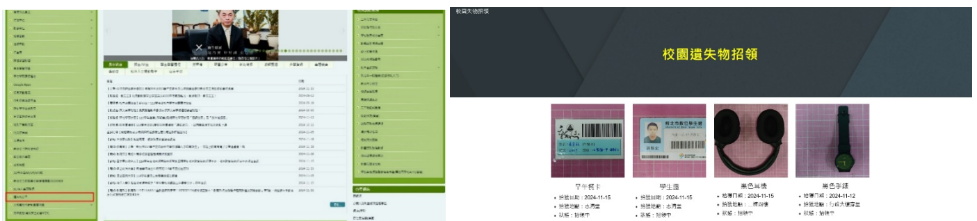
圖 校網遺失物公告

十一、有關於遺失物部分，目前校網左邊頁面有遺失物公告，協請導師告知學生們可先於校網查詢是否有其遺失物品，生輔組將會做滾動式修正。