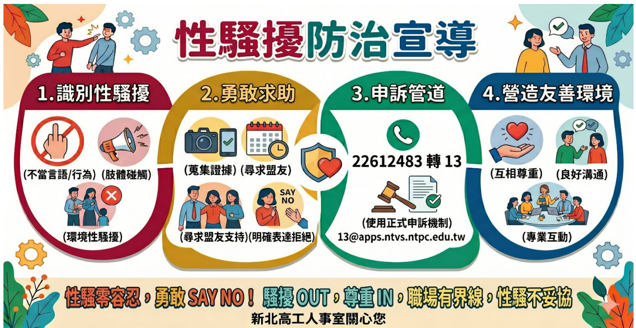
圖 性騷擾防治宣導