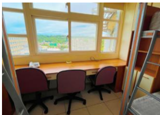
中央空調套房(3人房)