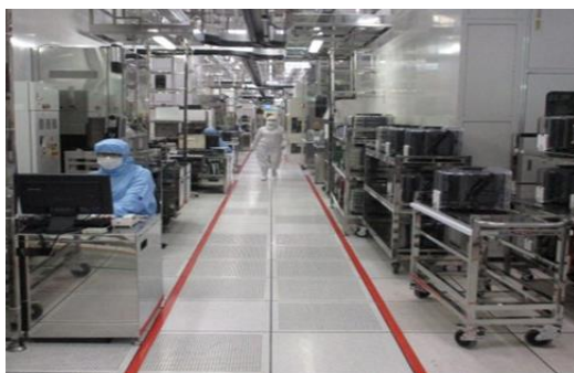
無塵室工作環境剪影