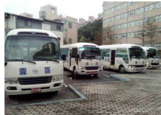
上下班/課免費交通車