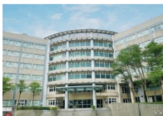
旺宏員工專屬宿舍