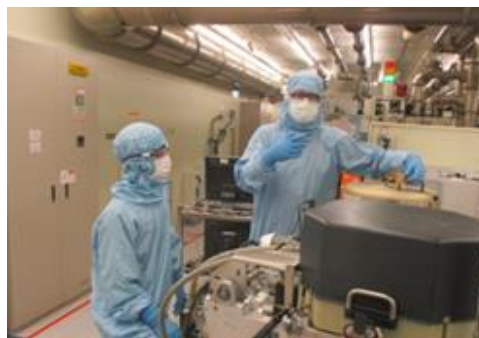
半導體機台操作實務訓練