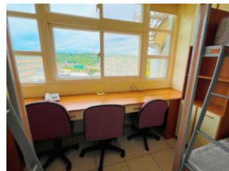
宿舍中央空調套房